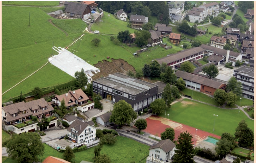
1500 M 3 DE BOUE ET D'ÉBOULIS ENVAHISSENT LA COUR DE RÉCRÉATION.