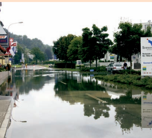
ÜBERFLUTET: DIE GEGEND RUND UM DEN ÄGERISEE.