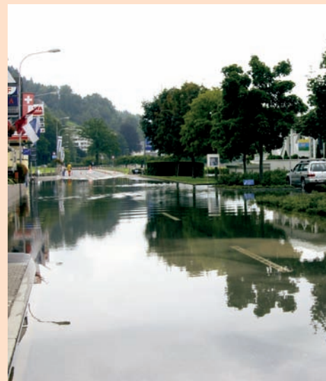
LA ZONA ALLUVIONATA ATTORNO AL LAGO DI ÄGERI

E qual è stata l'esperienza più bella che ha vissuto nella protezione civile? “Uno dei miei colleghi che prendeva spesso in giro la protezione civile si trovava proprio tra le persone evacuate dalla mia truppa durante