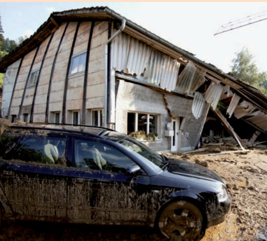
DIE GEWALT DES WASSERS UND IHRE FOLGEN.