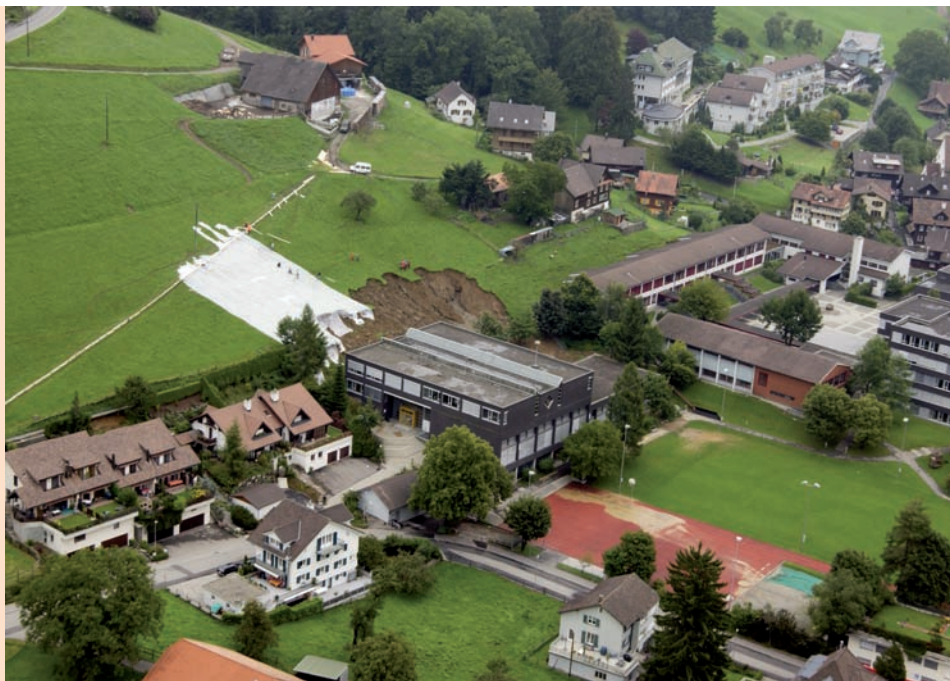
1500 m 3 SCHLAMM UND GERÖLL RUTSCHTEN AUF DEN PAUSENPLATZ DES SCHULHAUSES UNTERÄGERI.