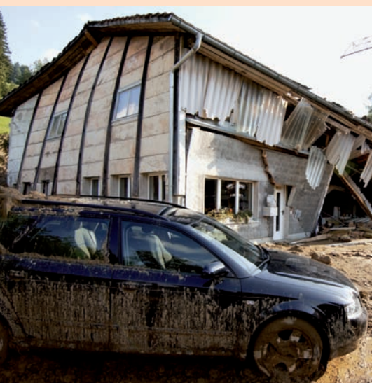
L'ALLUVIONE E LE SUE GRAVI CONSEGUENZE

A volte ci vuole un'esperienza diretta per capire a cosa servono organizzazioni come la protezione civile.