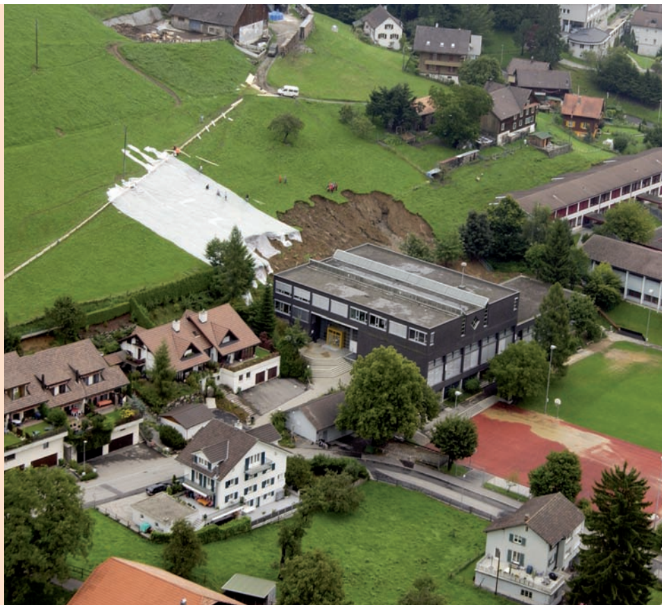
1'500 METRI CUBI DI FANGO E DETRITI SONO FRANATI SUL PIAZZALE SCOLASTICO DI UNTERÄGERI.

Anche la polizia del Canto Zugo stima la protezione civile. La collaborazione è infatti molto stretta. La protezione civile entra ad esempio in azione per aiutare la polizia a sorvegliare aree, come durante gli attentati