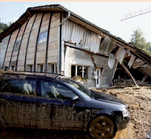
LA VIOLENCE DES EAUX ET SES CONSÉQUENCES